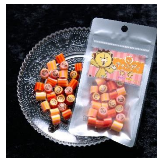
キンノキャンディ(全1種) 価格：1,200円