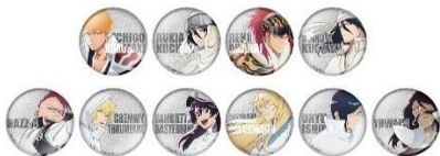
缶バッジコレクション (全10種/ランダム封入) 価格：1個550円/ コンプリートセット5,500円