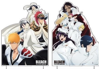
アクリルスタンド(全2種) 価格：各2,000円