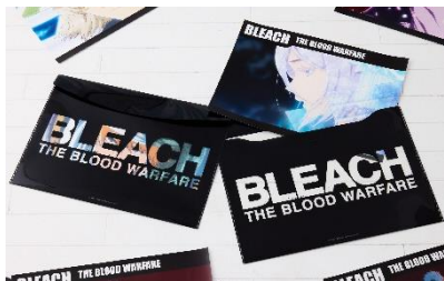
A3ポスターファイル(全1種) 価格：1,500円