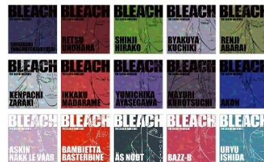
キラキラアクリルカードB (全15種/ランダム封入) 価格：1個770円/ コンプリートセット11,550円