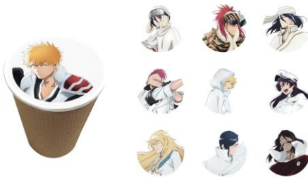
フォーチュンラテ(デザイン全10種) 価格：690円 好きなデザインをプリントできるラテです。

※アクリルコースター付きソフトドリンク、フォーチュンラテに「イラストシート」は付きません。