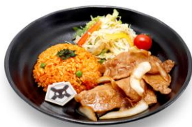
黒崎一護 (ポークジンジャー、チキンライス、サラダ) 価格：1,500円