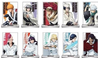
アクリルシートスタンド(全10種) 価格：各1,000円