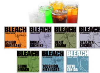
アクリルコースター付きソフトドリンク 価格：980円 アクリルコースター(全7種)がランダムで1枚付きます。